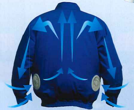
クールウェアの風の流れ