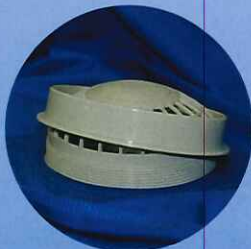
ファンの取付けはねじ込み式で外れる心配はありません。