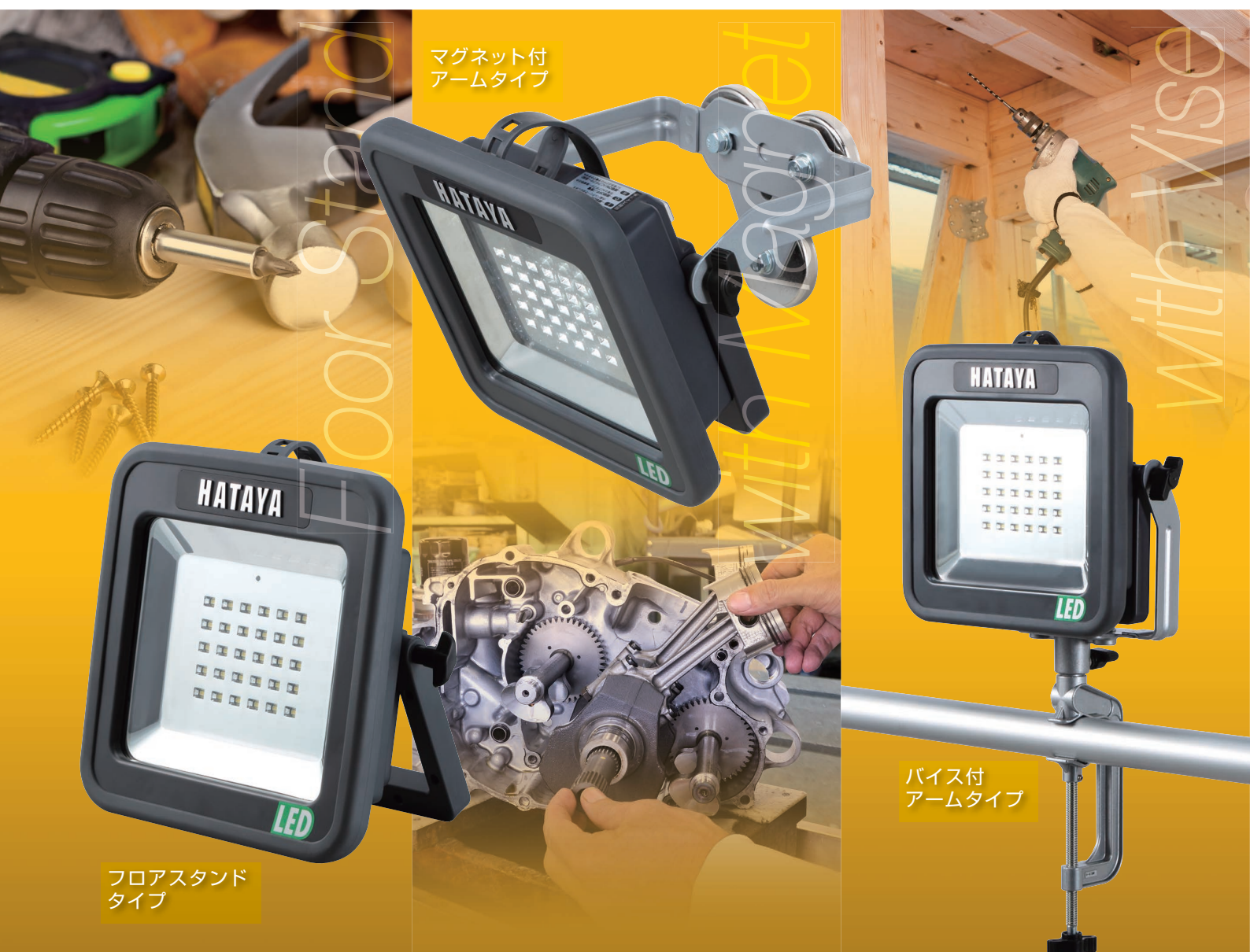
マグネット付 アームタイプ