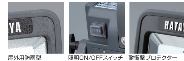
屋外用防雨型 照明ON/OFFスイッチ 耐衝撃プロテクター