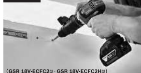
(GSR 18V-ECFC2型・GSR 18V-ECFC2H型)