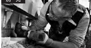
アングルアダプター装着時の作業例