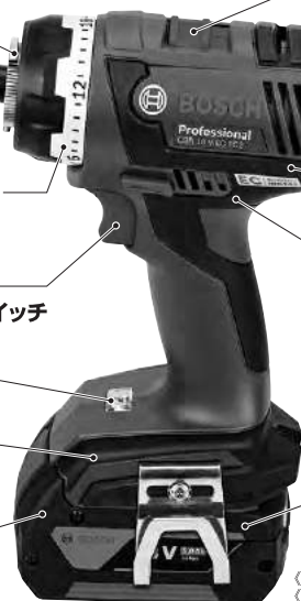
《画像はGSR 18V-ECFC2型/アダプター装着無し状態》 《サイズ:(H)246×(W)147×(D)71mm》