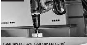
(GSR 18V-ECFC2型・GSR 18V-ECFC2H型)