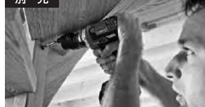
スミヨセアダプター装着時の作業例