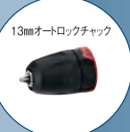
13mmオートロックチャック

SDS プラスハンマードリル アダプター(サイドハンドル付) GHA FC2 (標準付属) 標準小売価格 ¥19,500 (税別)