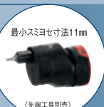
最小スミヨセ寸法11mm

スミヨセアダプター GEA FC2 (別売) 標準小売価格 ¥7,500 (税別) 9mm溝ビットが使用可能 16方向にワンタッチで 角度調整が可能。